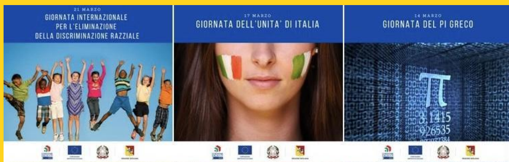
Card social giornate internazionali

piattaforma di consultazione del catalogo regionale dell'offerta formativa dedicata ai soggetti beneficiari